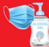
แจกแมส, เจล